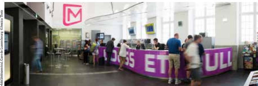
Mobilitétszentral, Gare de Luxembourg

Après avoir payé la caution de 20€, vous recevrez votre mKaart contenant la clé d'accès par voie postale.